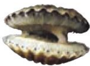
صدف دو کفه‌ای

تصویرهای زیر را ببینید. هر یک از این جانوران در کجا زندگی می کنند؟